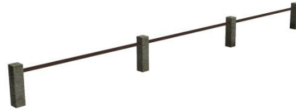
Gelaender_Winkeleisen_RE1 + Begrenzungssteine1-4_RE1