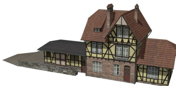
Bahnhof-Porstendorf_SG1 (mit Tauschtextur)