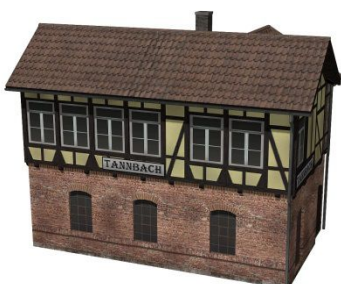
Stellwerk_Porstendorf_SG1 (mit Tauschtextur)