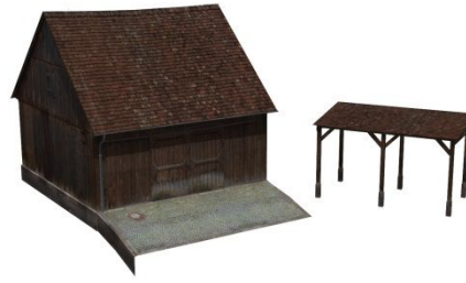
Knobelsdorf_Scheune_08_JE1 + Anbau_JE1