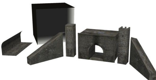
Tunnelmodule_SB4 + Tunnelblende_FS1